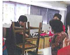
椅子の張替え教室

*1: 市民個人個人が対象です。業務用の方は利用できません。また、リフレッシュプラザのみでのご利用に限り、商店・事業所などでは利用できません。 *2: 使用したポイントには消(済)マークを押印します。おつりはできませんのでご注意ください。